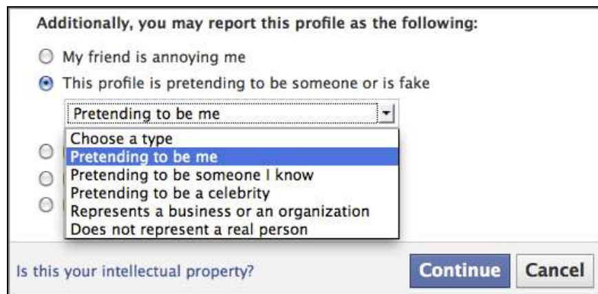
Ilustración 8: Denunciar suplantación de identidad

Dirígete al perfil falso. Haz clic en el enlace “Denunciar/Bloquear a esta persona” . Selecciona la opción: “Este perfil suplanta la identidad de alguien o es falso” > “Se hace pasar por mí” y para enviar la denuncia finalmente darle a “Continuar” . Si no puedes quizá pueda un amigo tuyo.