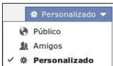
Ilustración 4: Opciones de visibilidad para el contenido que compartes

Hay otro tipo de información que es la que tu DECIDES hacer pública, y es la información que compartes en cada actualización de estado, foto que subes, publicación que compartes, etc. Puedes elegir entre hacerla visible de manera pública, sólo a tus amigos o personalizarla a través del uso de Listas o seleccionando de manera manual, qué usuarios pueden y qué usuarios no pueden ver esa publicación.