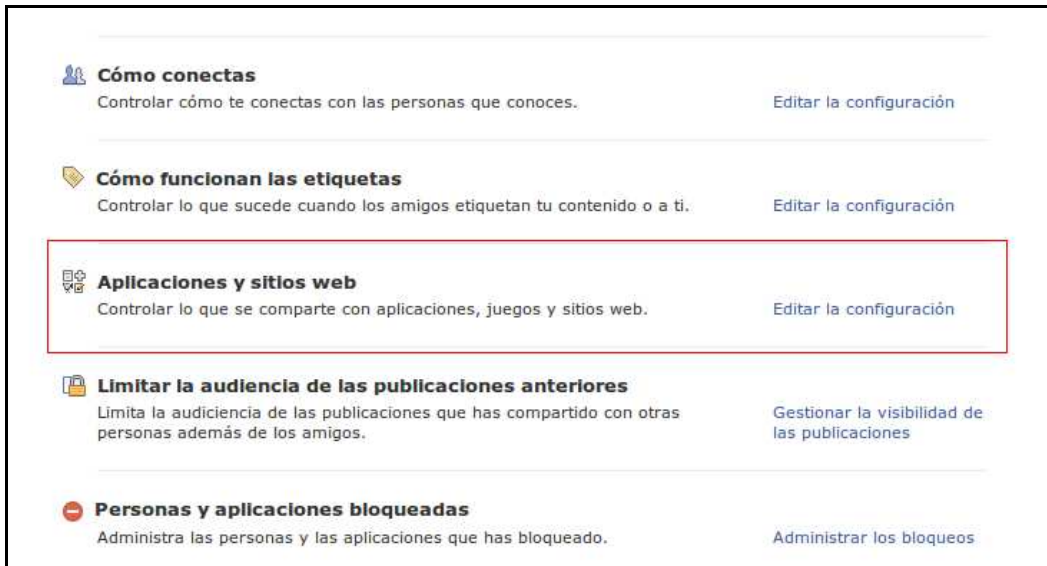
Ilustración 1: Control sobre lo que se comparte con aplicaciones, juegos y sitios Web