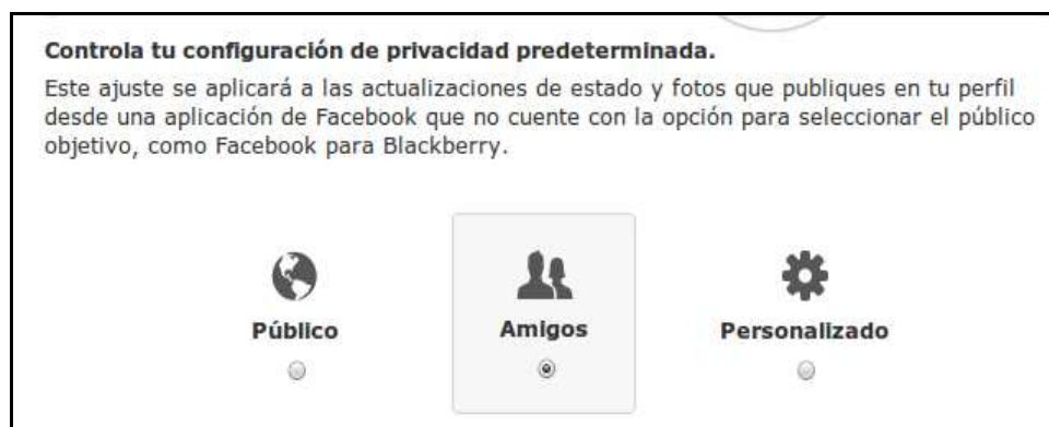
Ilustración 5: Tipo de configuración de la privacidad predeterminada

En “ Cuenta ” > “ Configuración de la privacidad ” puedes ajustar tu configuración de privacidad predeterminada para que por defecto cualquier actualización de estado o foto que publiques en tu muro solo sea visible para esa privacidad determinada que elijas. Puedes escoger que tus publicaciones las pueda ver todo Internet (Público), sólo tus Amigos o hacer una personalización a través del uso de Listas .