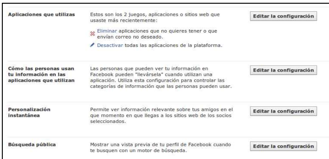
Ilustración 2: Información sobre las aplicaciones utilizadas. Lo que compartes tú y tus amigos con ellas.