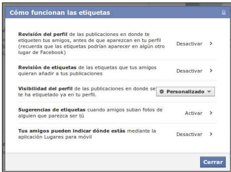
Ilustración 6: Opciones para configurar el etiquetado en Facebook

Os animamos a revisar de manera periódica dada una de las opciones de la parte de “Cuenta” > “Configuración de la privacidad” para asegurarnos que todo está como queremos.