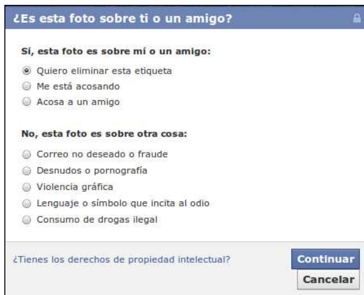
Ilustración 7: Opciones de Reportar/Eliminar etiqueta

Si encuentras un contenido que creas que puede ser ofensivo (una imagen, una página, etc.) puedes denunciarlo haciendo clic en el enlace “ Denunciar ” o “ Reportar ” que aparece junto a dicha publicación. Si encuentras una foto en la que apareces, te han etiquetado o refleja un contenido ofensivo, puedes hacer clic en el botón de “ Reportar/Eliminar ” etiqueta donde podrás realizar cualquiera de las opciones que quedan reflejadas en la siguiente imagen: